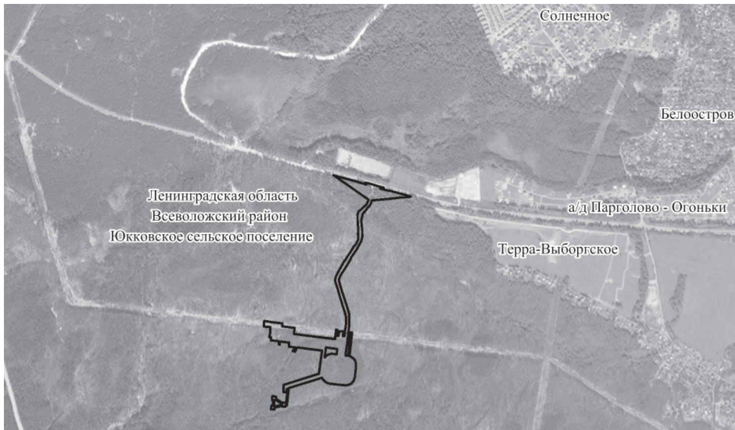
СХЕМА ГРАНИЦ ПУБЛИЧНОГО СЕРВИТУТА ГРС «БЕЛООСТРОВ» Ленинградская область, Всеволожский район, Юкковское сельское поселение