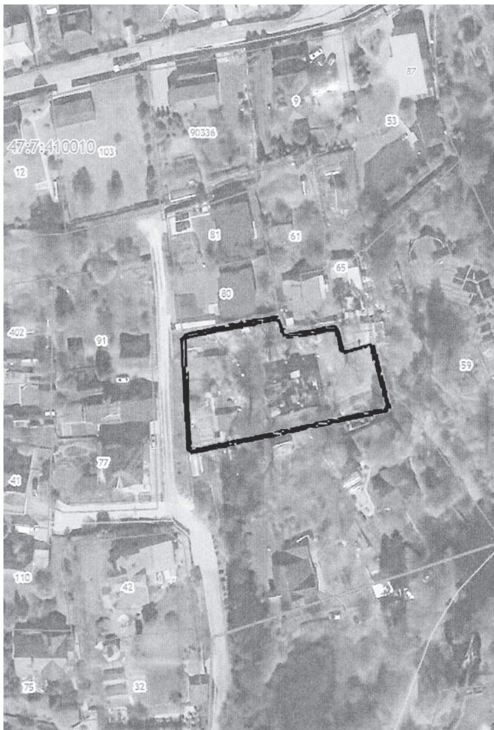
СХЕМА ГРАНИЦ ЗЕМЕЛЬНОГО УЧАСТКА

Приложение к постановлению администрации МО Юкковское сельское поселение №136 от 18.04.2022